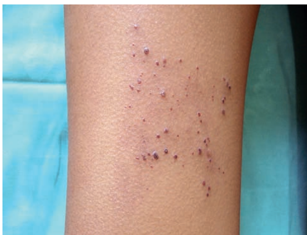
Fotografía 2: Pápulas eritematovioláceas queratósicas en muslo derecho. Mayor aproximación.

Exámenes auxiliares hematológicos y bioquímicos sin alteraciones.