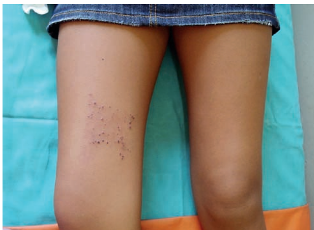
Fotografía 1: Mácula eritematoviolácea y pápulas queratósicas en región media de muslo derecho.

Al examen clínico se observan pápulas eritematovioláceas queratósicas de escaso diámetro, firmes a la palpación, agrupadas sobre región media de muslo derecho asentando en un fondo de piel eritematoviolácea. Resto del examen cutáneo sin alteraciones significativas ( fotografías 1 y 2 ).