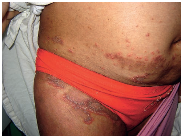
Fotografía 1. Se visualiza placas eritematosas con pústulas periféricas.