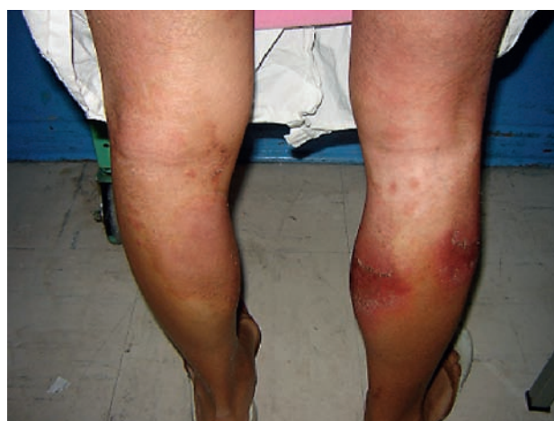
Fotografía 3. Compromiso de pierna derecha, cara posterior.