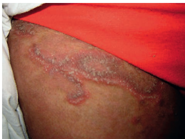
Fotografía 2. Mayor aproximación de la lesión.

Posteriormente aparecen lesiones similares en abdomen, ingles y muslos. Acude a médico particular en donde le diagnostican "alergia" e inician tratamiento con clobetasol en crema, dos veces al día, con mejoría parcial, reapareciendo luego las lesiones en otras zonas. Hace un mes aparece nueva placa eritematosa en pantorrilla derecha de similares características, la cual no responde al tratamiento indicado, tornándose más eritematosa y dolorosa, impidiendo la deambulacion ( fotografía 3 ).